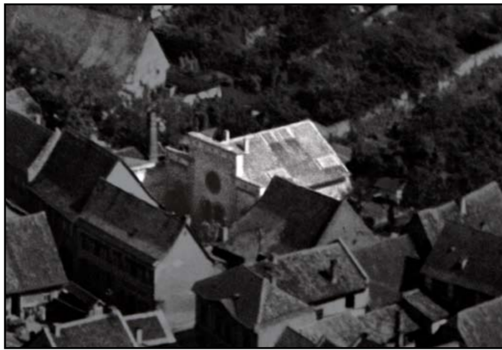
DIE INGELHEIMER SYNAGOGE 1930

In the year 1992, pupils of the Sebastian-Münster High School and the German Israeli Society of Friends in Ingelheim erected this stele.